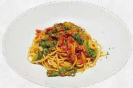
ベーコンと季節野菜のアラビアータ (スパゲッティ) 1,650