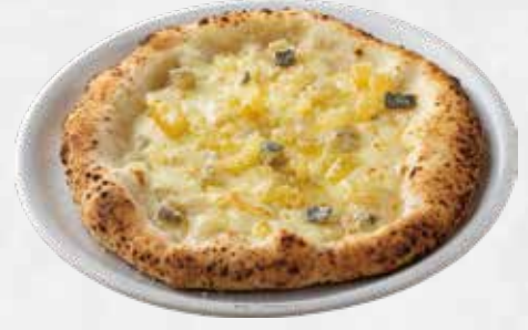
ゴルゴンゾーラ&ハチミツ 2,200