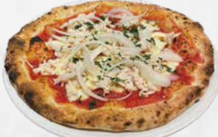
ポッコロ 1,800 (ローストチキンと玉ねぎのトマトソース)