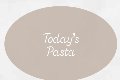
ジョルノパスタ(本日のパスタ) スタッフがご説明致します 1,650