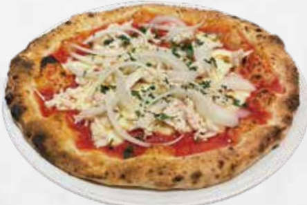
ポッコロ 1,800 (ローストチキンと玉ねぎのトマトソース)