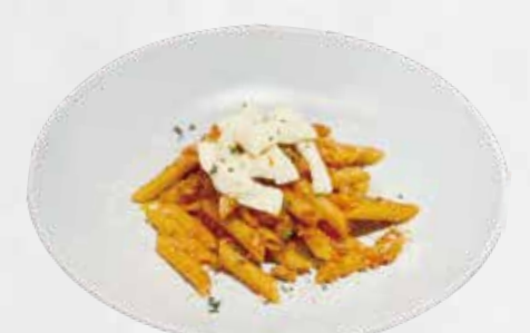
ペンネ ボロネーゼ 1,700