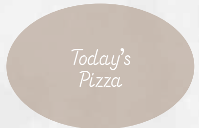
ジョルノピッツァ(本日のピッツァ) スタッフがご説明致します 1,650