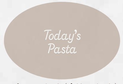
ジョルノパスタ(本日のパスタ) スタッフがご説明致します 1,650