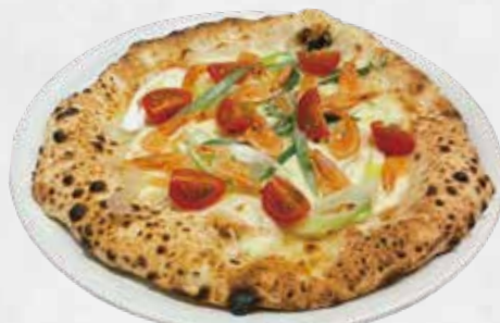
ガンバーレット 1,750 (桜海老とひかりねぎのピアンカ)