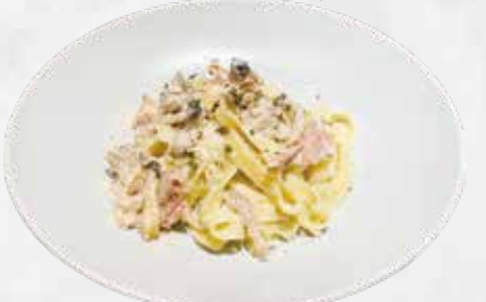
フェットチーネ 生ハムと茸のクリームソース 2,000