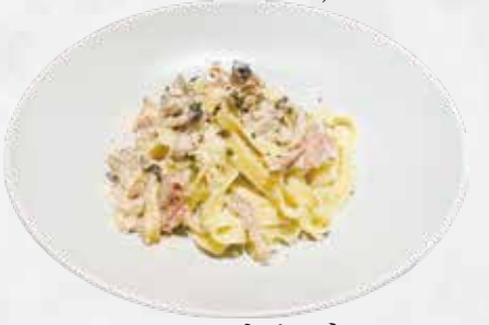
フェットチーネ 生ハムと茸のクリームソース 2,000