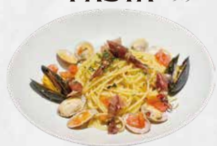
ペスカトーレ(あさり・ムール貝・ホタルイカ) 1,850