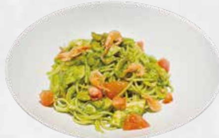
桜海老と筍の ジェノベーゼ 1,850