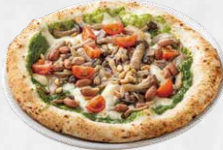
ジェノベーゼモンティ 1,850