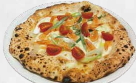
ガンバーレト 1,750 (桜海老とひかりねぎのピアンカ)